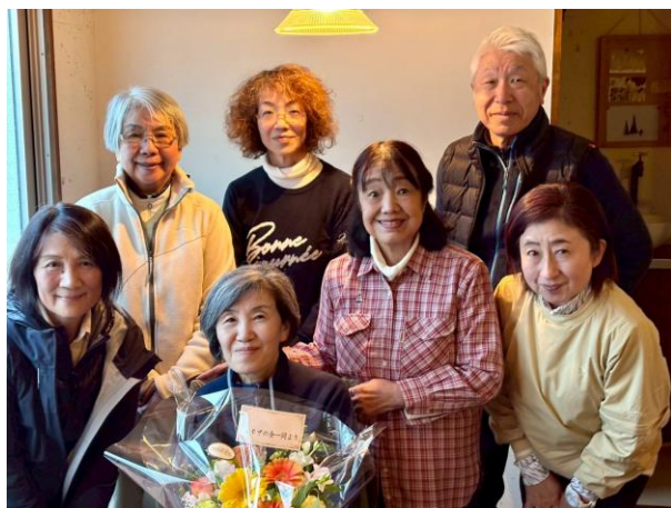
日本茶カフェ 一日